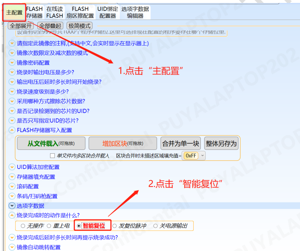
图 4-4 轩微操作“智能复位”