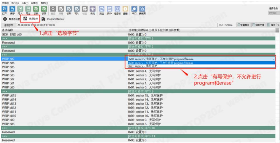
图 4-1 创芯工坊操作 Option 写保护