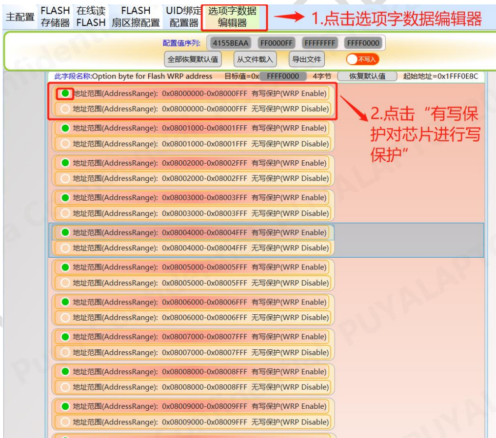
图 4-2 轩微操作 Option 写保护